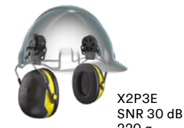
X2P3E SNR 30 dB 220 g