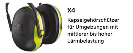
X4 Kapselgehörschützer für Umgebungen mit mittlerer bis hoher Lärmbelastung