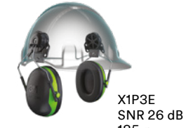
X1P3E SNR 26 dB 185 g