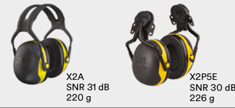
X2A SNR 31 dB 220 g X2P5E SNR 30 dB 226 g