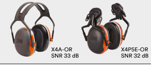
X4A-OR SNR 33 dB X4P5E-OR SNR 32 dB