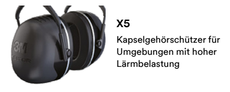
X5 Kapselgehörschützer für Umgebungen mit hoher Lärmbelastung