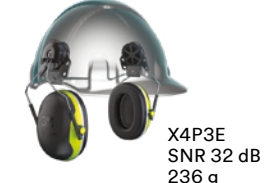
X4P3E SNR 32 dB 236 g