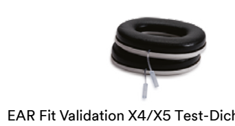
EAR Fit Validation X4/X5 Test-Dichtungsringe