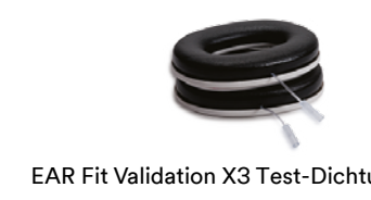
EAR Fit Validation X3 Test-Dichtungsringe