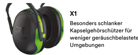
X1 Besonders schlanker Kapselgehörschützer für weniger geräuschbelastete Umgebungen