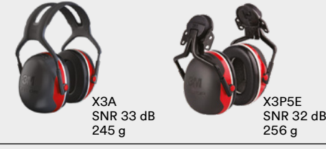
X3A SNR 33 dB 245 g X3P5E SNR 32 dB 256 g