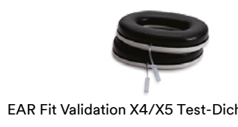
EAR Fit Validation X4/X5 Test-Dichtungsringe