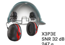
X3P3E SNR 32 dB 247 g