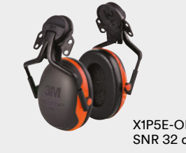
X1P5E-OR SNR 32 dB