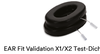
EAR Fit Validation X1/X2 Test-Dichtungsringe