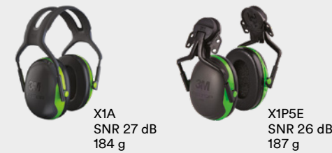
X1A SNR 27 dB 184 g X1P5E SNR 26 dB 187 g