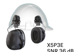
X5P3E SNR 36 dB 353 g