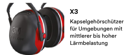
X3 Kapselgehörschützer für Umgebungen mit mittlerer bis hoher Lärmbelastung