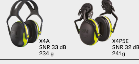
X4A SNR 33 dB 234 g X4P5E SNR 32 dB 241 g