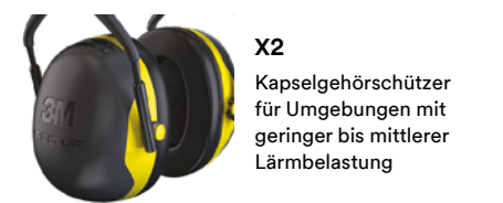
X2 Kapselgehörschützer für Umgebungen mit geringer bis mittlerer Lärmbelastung